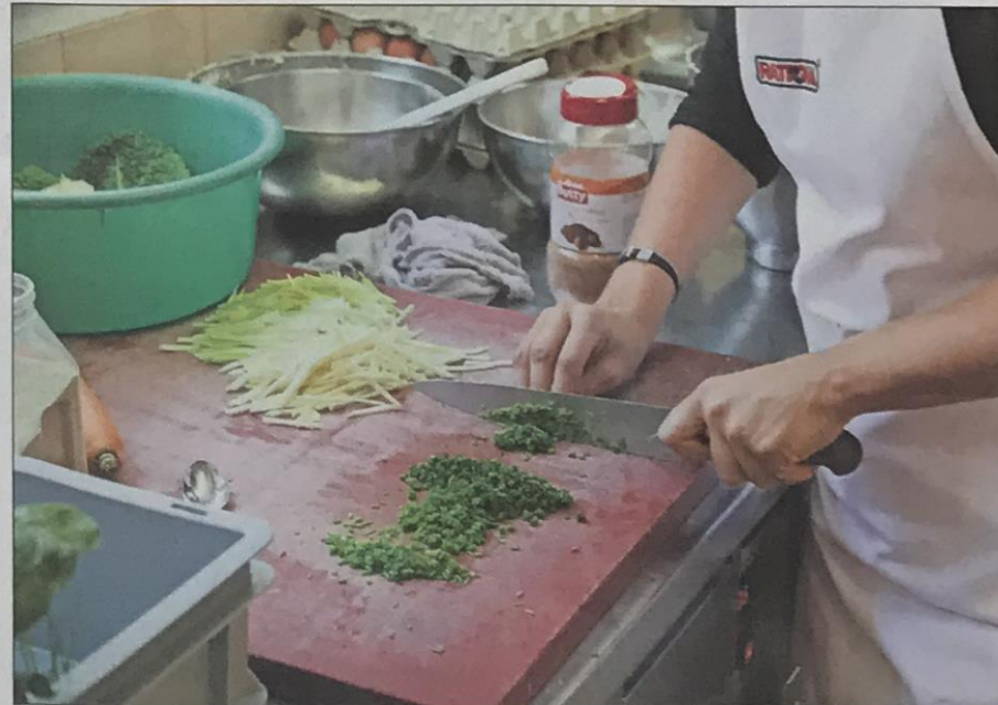
Eir a cuschinar as poja imprendere pro la Pro Manufacta Engiadina a Scuol.